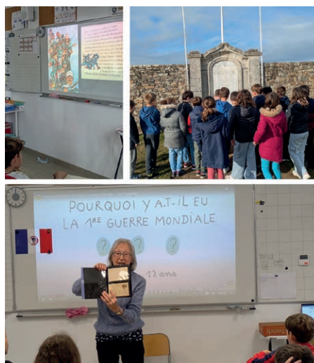
Souvenirs, symboles et citoyenneté : un projet autour de la mémoire (Classe CM1)

autres. Une équipe « bien-être » se forme actuellement pour favoriser un climat scolaire épanouissant, où règnent l'empathie, le respect et la confiance en soi.